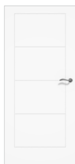
Postformée et Postformée Tendance