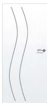
Rainurée Beaux-arts et matriciée